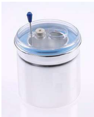
Рис. 1. Калориметр.

Нужно также уменьшить потери тепла - теплообмен с внешней средой. С этой целью используется калориметр . В нем, подобно термосу, внутренний стакан помещен в теплоизолирующую оболочку из пенопласта; сверху калориметр накрывается пластиковой крышкой, через отверстие в которой вставляется термометр (См. рисунок 1).